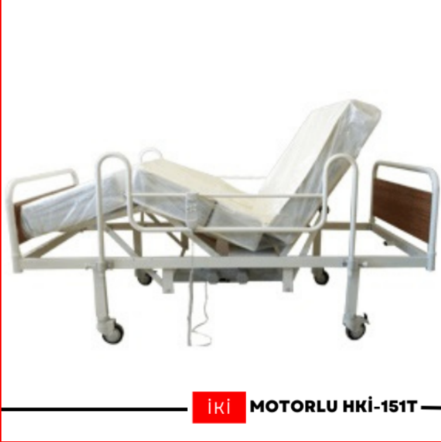
İKİ MOTORLU HKİ-151T