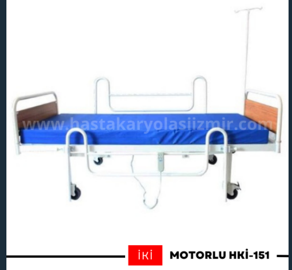
İki MOTORLU HKİ-151