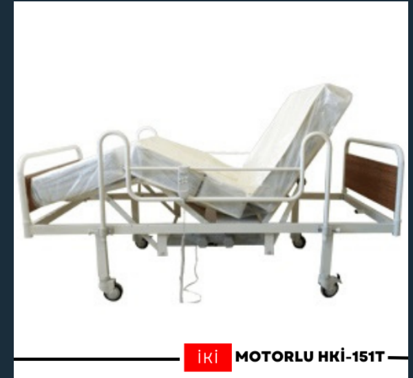
İKİ MOTORLU HKİ-151T