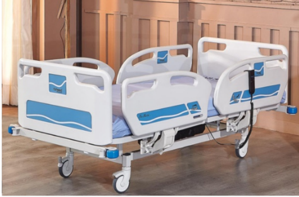
İki MOTORLU HKİ-4062