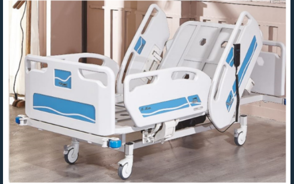
İki MOTORLU HKİ-4062