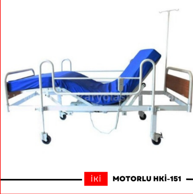
İki MOTORLU HKİ-151