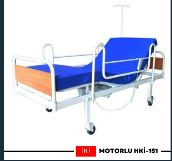
İki MOTORLU HKİ-151