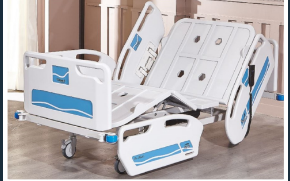
İki MOTORLU HKİ-4062