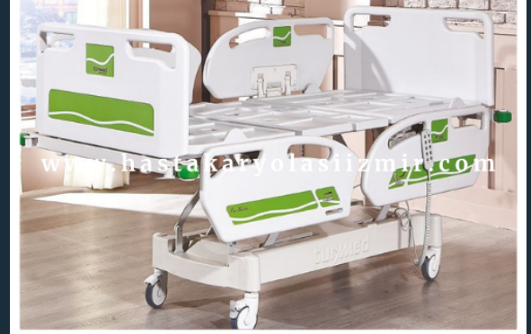
ÜÇ MOTORLU HKİ-4055