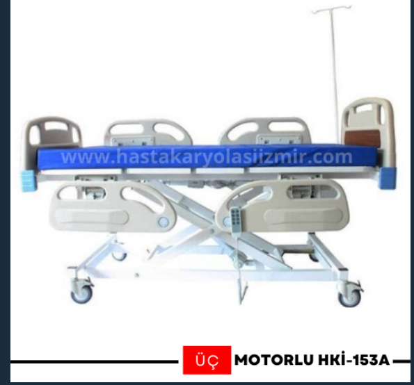
ÜÇ MOTORLU HKİ-153A