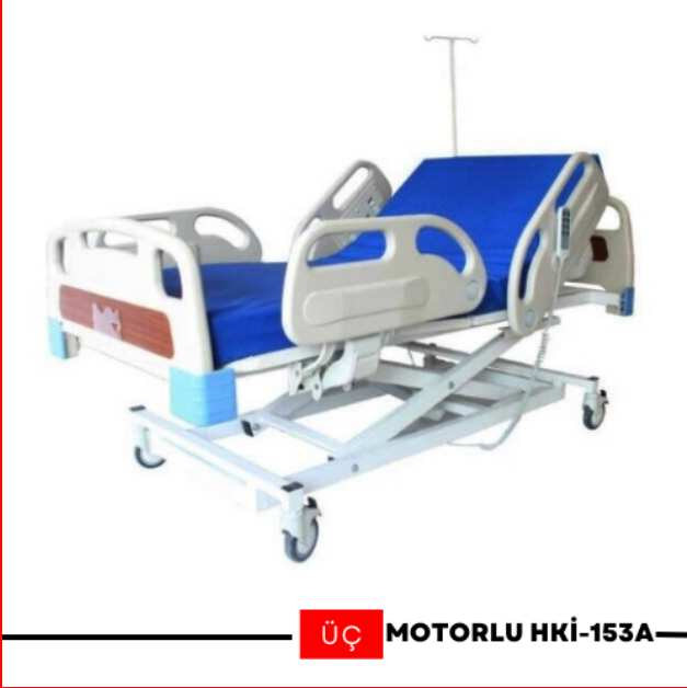
ÜÇ MOTORLU HKİ-153A