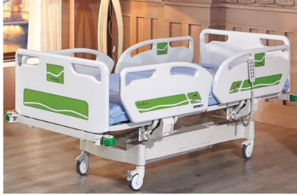
ÜÇ MOTORLU HKİ-4055