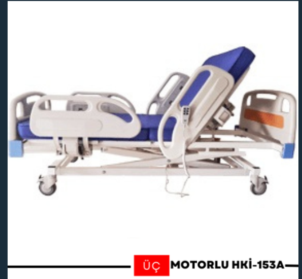
ÜÇ MOTORLU HKİ-153A