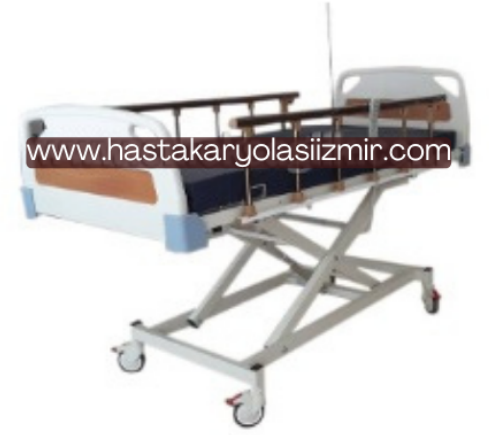
ÜÇ MOTORLU HKİ-153