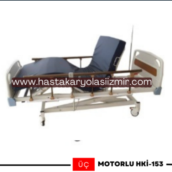
ÜÇ MOTORLU HKİ-153