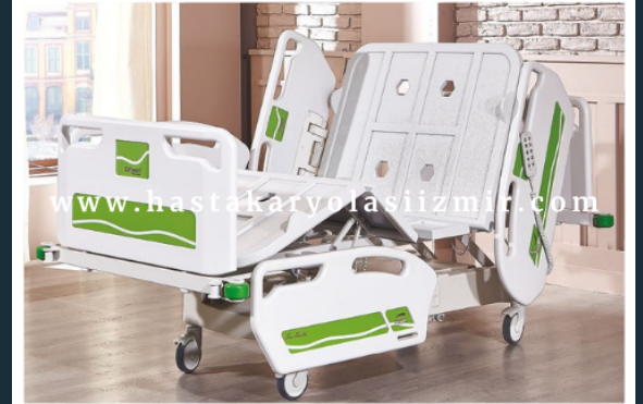
ÜÇ MOTORLU HKİ-4055