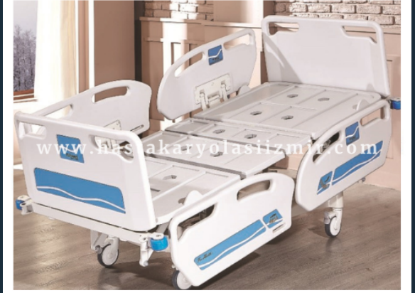
DÖRT MOTORLU HKİ-4056