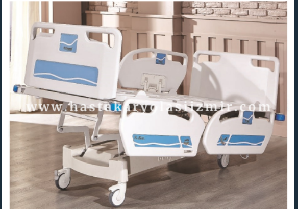
DÖRT MOTORLU HKİ-4056