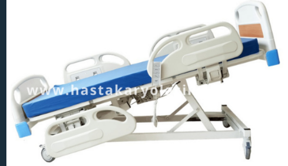
DÖRT MOTORLU HKİ-404