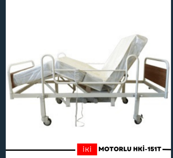
İKİ MOTORLU HKİ-151T