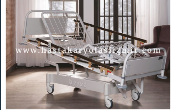
DÖRT MOTORLU HKİ-4059