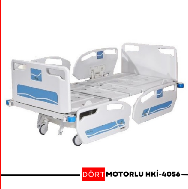
DÖRT MOTORLU HKİ-4056