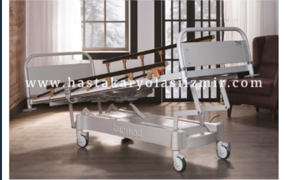
DÖRT MOTORLU HKİ-4059