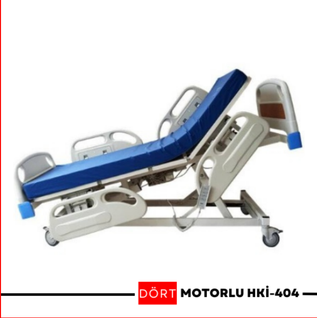
DÖRT MOTORLU HKİ-404