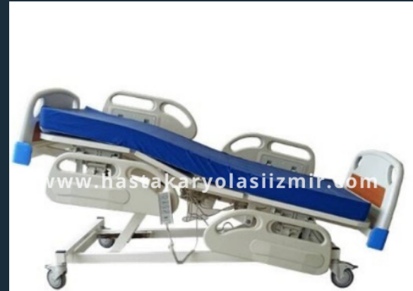
DÖRT MOTORLU HKİ-404