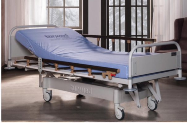
DÖRT MOTORLU HKİ-4059